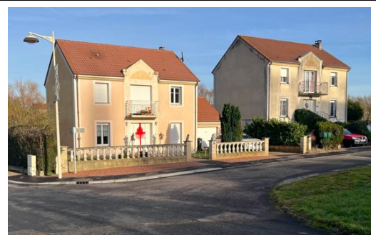
Ci-dessus la rue des Jardins

Enfin, nous avons voulu que l'immeuble de caractère « Chaudeur » demeure mis en valeur sur ce singulier et plaisant espace.