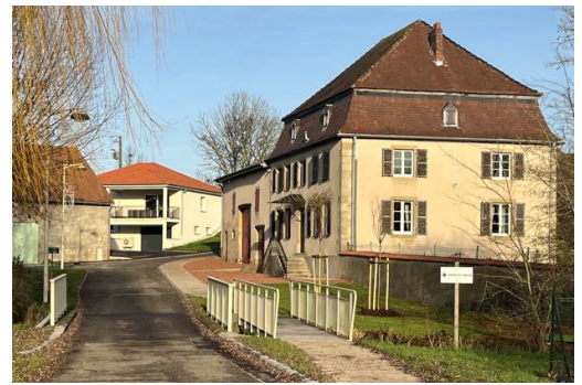
Ci-dessous la place du Moulin avec la passerelle