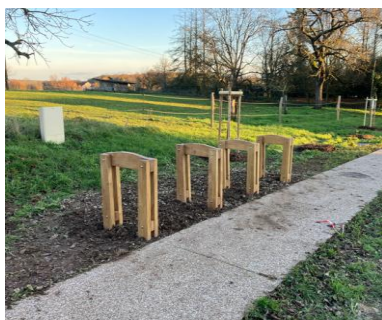
Ci-dessous des supports pour des vélos

Il nous paraît utile de préciser que le mobilier et la signalétique mis en place sont imposés par le règlement pour l'octroi des aides dont la thématique est fortement axée sur des projets environnementaux avec lesquels nous sommes également très attachés.