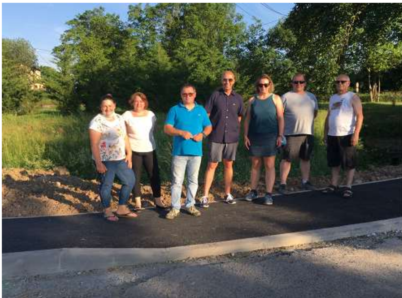
Les conseillers visitent le chantier du Quartier de la Gare